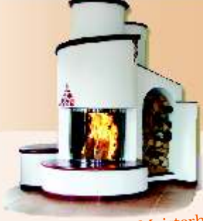
Ihr Plus! Alles aus Meisterhand.

Als Zyklon bezeichnet man den Vorratsbehälter in dem die Pellets, bevor sie in die Brennkammer kommen, zwischengelagert werden.